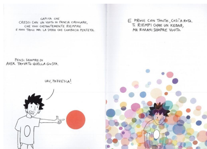
FIG. 2 – TRENTA (2022), PP. 24-25.

I maschi hanno corpi possenti I maschi non piangono mai I maschi sono dei combattenti I maschi sono guerrafondai I maschi premono il grilletto I maschi prendono le cose di petto I maschi devono essere virili I maschi provano sempre attrazione I maschi non sono gracili I maschi amano le ragazze facili I maschi anno sempre ragione.