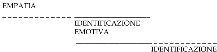
FIG. 1: CONDIZIONI PSICOLOGICHE DEL LETTORE NELLA DIMENSIONE EMPATIA-IDENTIFICAZIONE

mediazione tra l'organizzazione psicologica precedente e l'esperienza della lettura (Iser, 1987). Essendo la lettura una attività complessa, Maria Chiara Levorato ha proposto di visualizzarla come segue (Fig. 1).