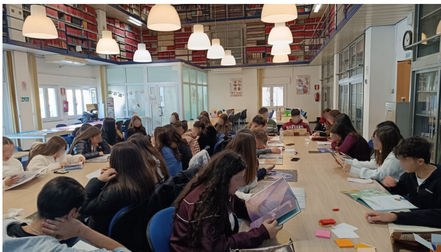
Figura 1 Lettura silenziosa individuale

Ho ideato, progettato e condotto il laboratorio nel contesto del dottorato di ricerca Tecnologie e metodi per la formazione universitaria , in cui porto la mia esperienza in educazione alla lettura, biblioteconomia e letteratura per l'infanzia e ragazzi. L'attività, organizzata dal Sistema bibliotecario di Ateneo dell'Università di Palermo, si è svolta presso la biblioteca universitaria di medicina ed è stata rivolta a due classi del liceo socio-pedagogico Danilo Dolci . Hanno partecipato 40 studenti del biennio, di età compresa tra i 14 e i 16 anni. I partecipanti sono stati suddivisi in due gruppi disposti attorno a due grandi tavoli. L'attività ha combinato momenti di lettura condivisa e dialogica con discussione collettiva, pause di riflessione, scelta autonoma dei testi e lettura silenziosa individuale (Fig. 1).